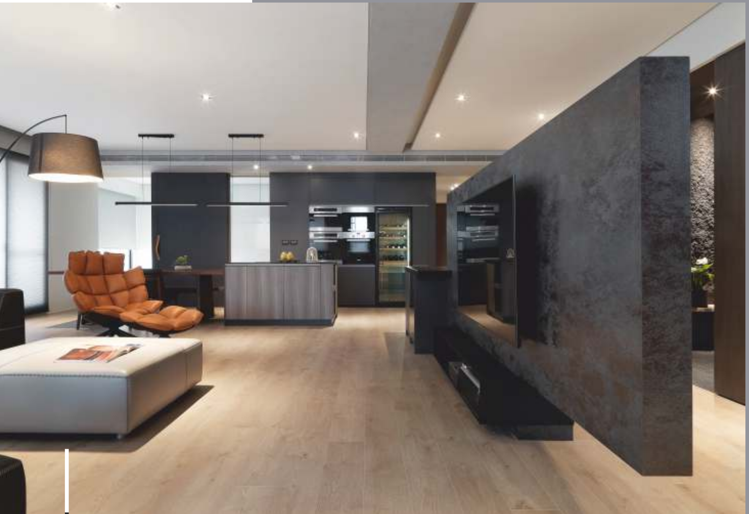
14H14 LIVAB, Taiwan