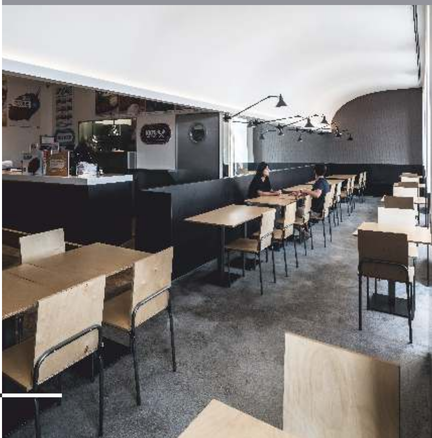
Restaurante H3