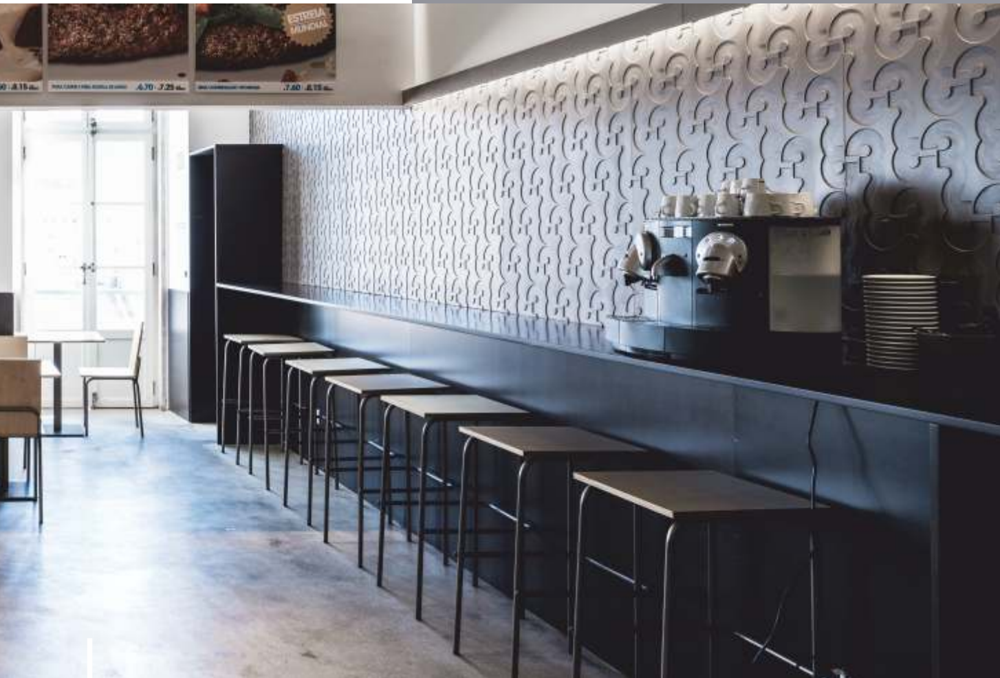
Restaurante H3