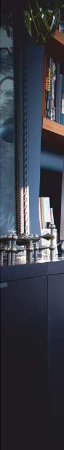
Silla Baaxal | Project © Designer: Christian Pacheco Furniture: Momé