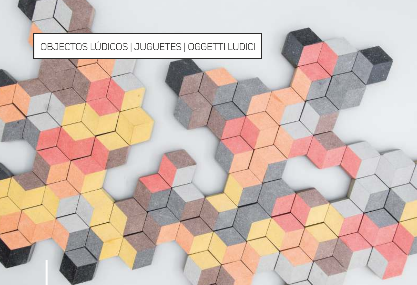
The grid game | Mexico © Design Studio