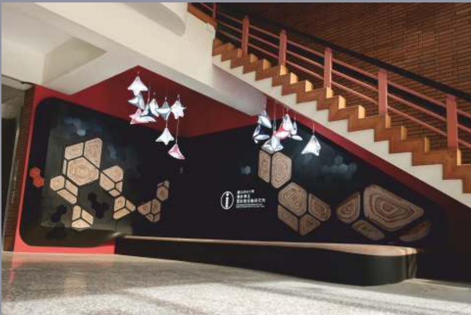
Department of Accountancy and Institute of Finance at National Cheng Kung University, Taiwan © Sky_Associative Design Team