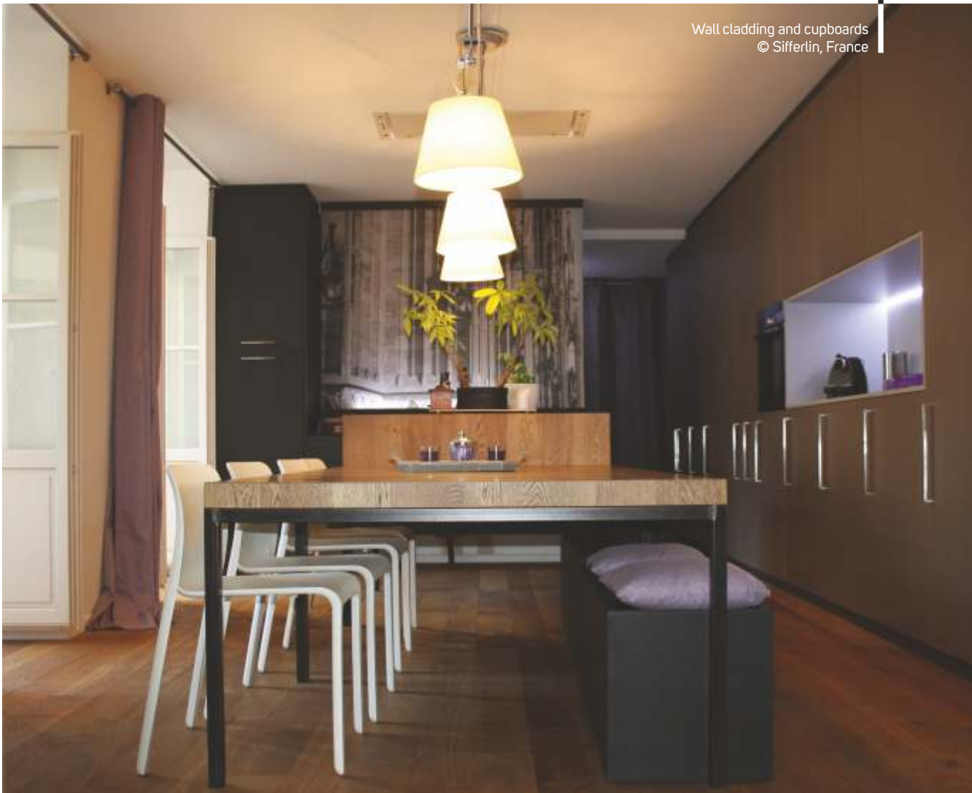
Wall cladding and cupboards