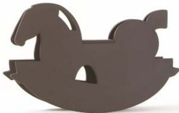
Cradle and rocking horse